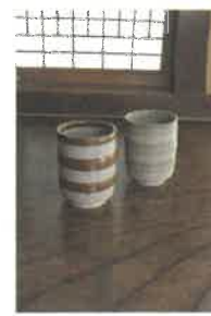
茶葉と茶器のセットが10名様当たりです。※画像はイメージです。